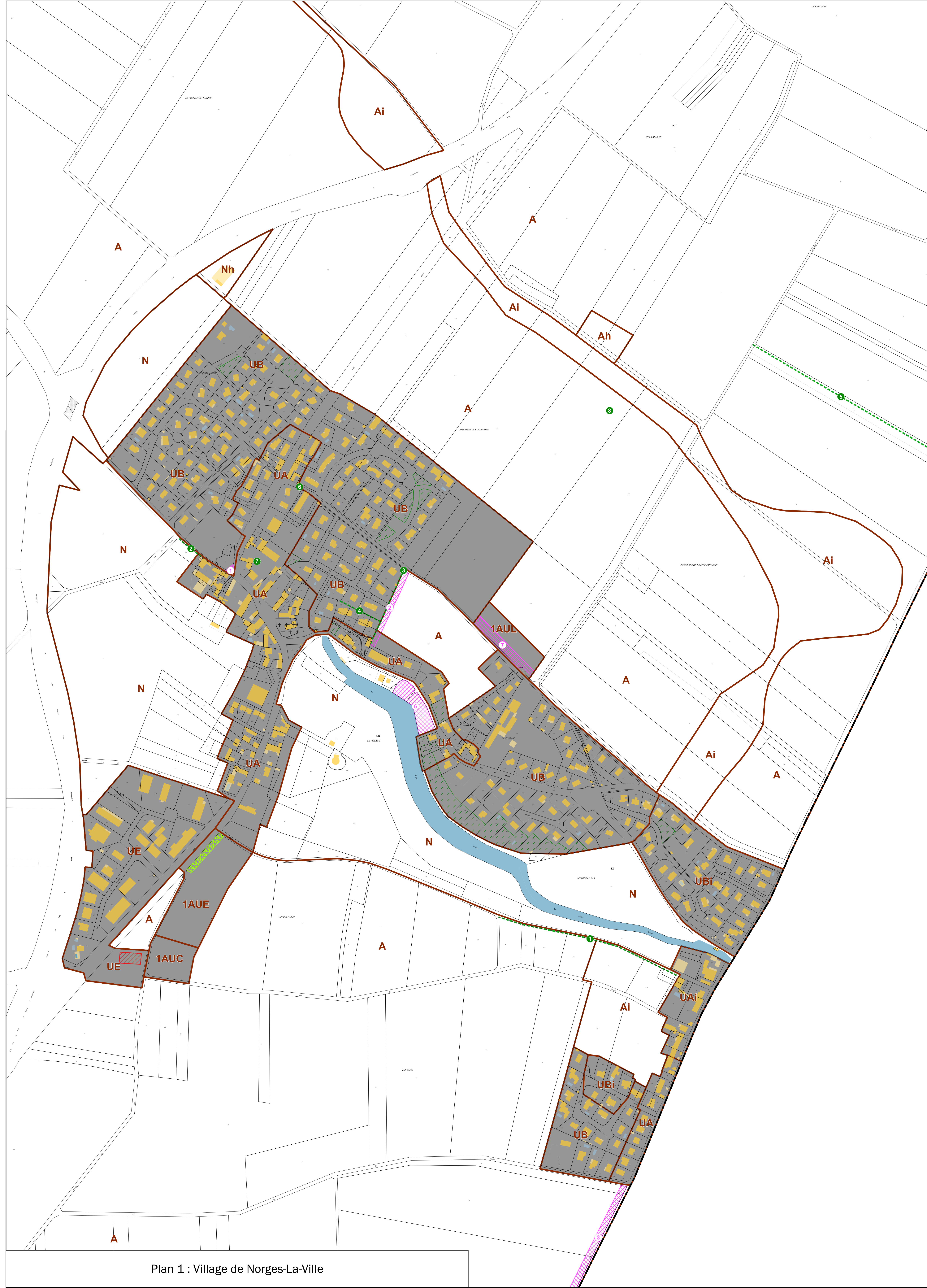
Plan 1 : Village de Norges-La-Ville